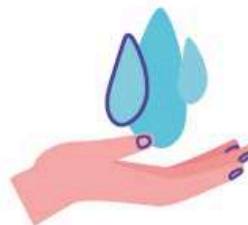
Lavez vos mains